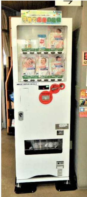
《子育て応援自動販売機》 イメージ