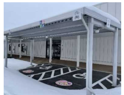
《妊婦向け屋根付き優先駐車スペース》