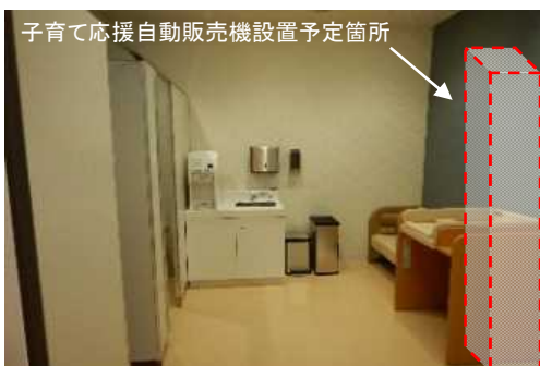
《24時間利用可能なベビーコーナー》